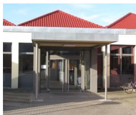
Heilpäd. Tagesstätte St. Nikolaus-Schule, SVE Am Maradies 9 97828 Marktheidenfeld