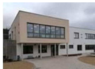
Heilpäd. Tagesstätte Berufsschulstufe Am Maradies 9 97828 Marktheidenfeld