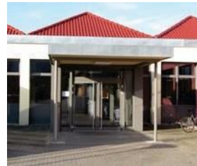
St. Nikolaus-Schule mit Heilpäd. Tagesstätte

Am Maradies 9 97828 Marktheidenfeld Tel.: 09391 / 9810-20